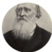
Алексей Плещеев Внучка

Ссылка: https://poemata.ru/poems/grandma/